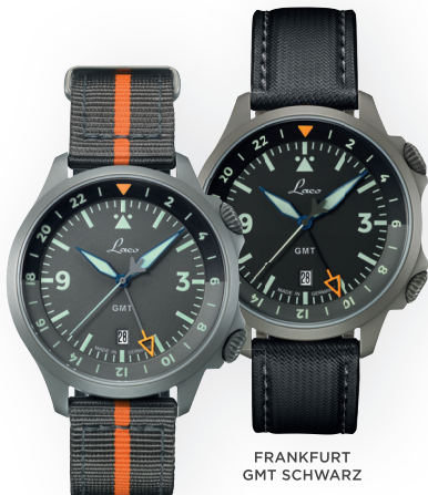
FRANKFURT GMT GRAU

HERZLICHEN GLÜCKWUNSCH ZU IHRER NEUEN LACO UHR!